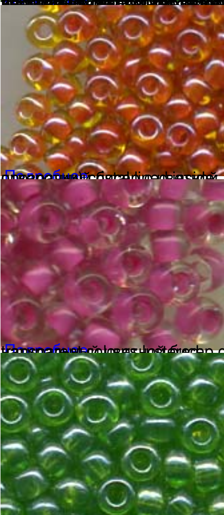
Полупрозрачные цвета серебристый/кв.ч./ блестящие с блеском (с блестящим покрытием на поверхности)