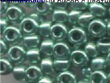
Матричный бисер с покрытием "зеленая ирис" (green iris) - покрытие бисера, которое не выцветает и не стирается