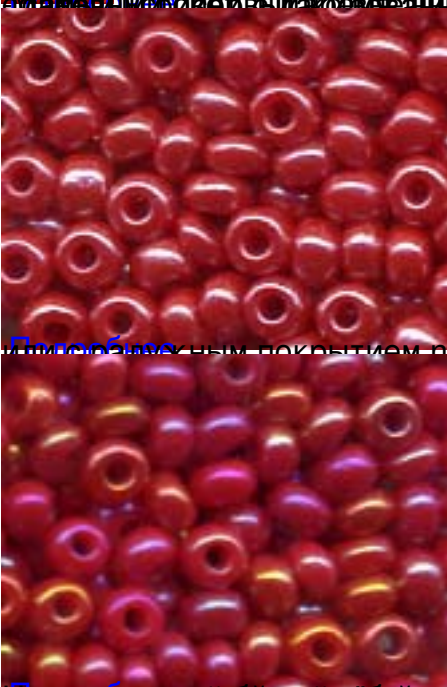
Матричный бисер с покрытием natural opaque colours rainbow